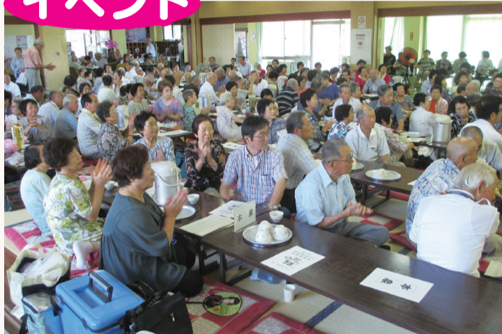
いきいきシルバー芸能発表会