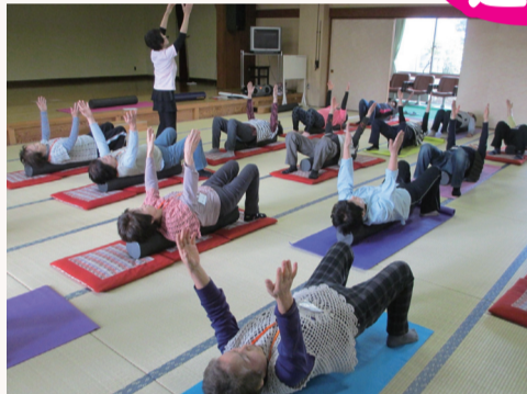
ストレッチポール