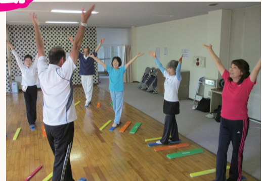
バランススティック