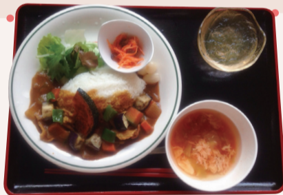
日替わり健康定食 500円

つきみ荘の チューリップ食堂は、 “塩分控えめ野菜たっぷりの 「埼玉県コバトン健康メニュー」の基準を満たしたメニューを 提供する飲食店”に選ばれました。